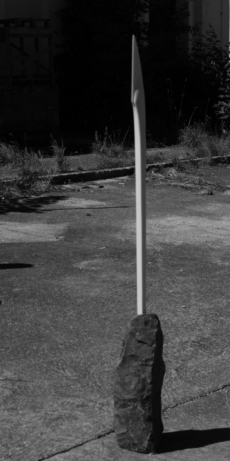
„in cima“ Laaser Marmor/ Hartsandstein 180 cm hoch 2022